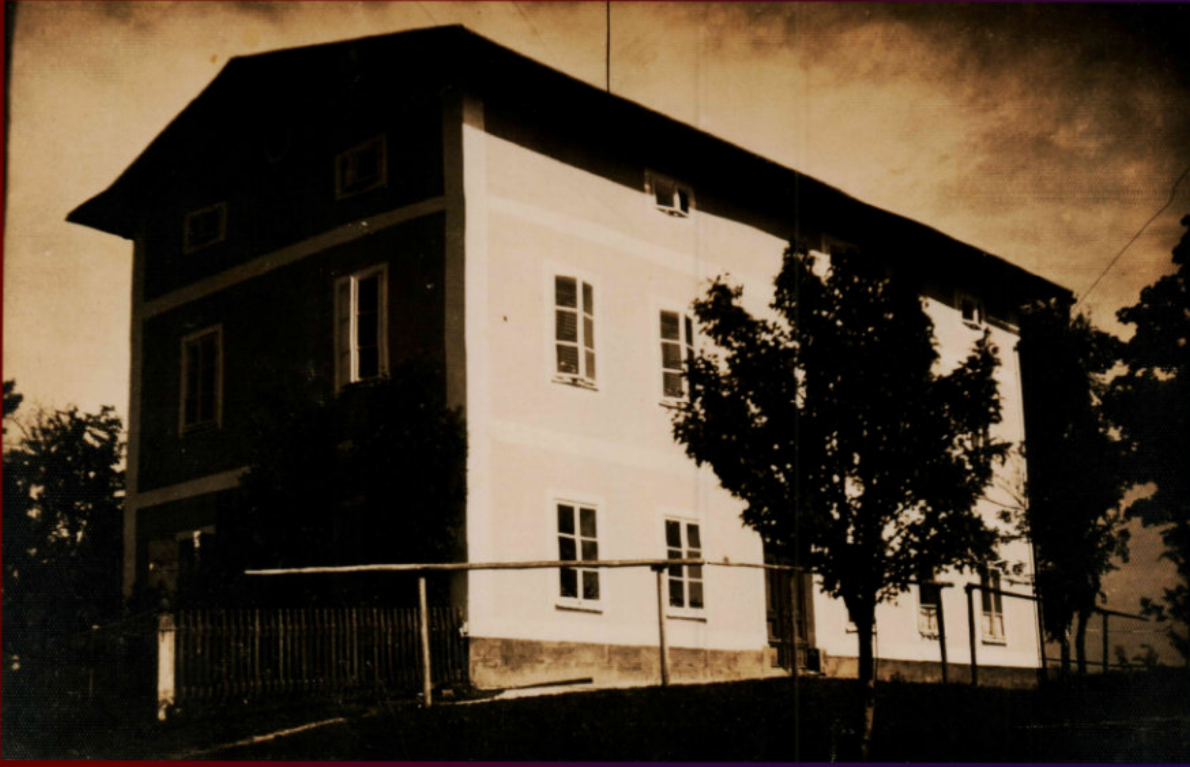
DŮM ČP.250 - FOTILI PŮVODNÍ OBYVATELÉ - 1944