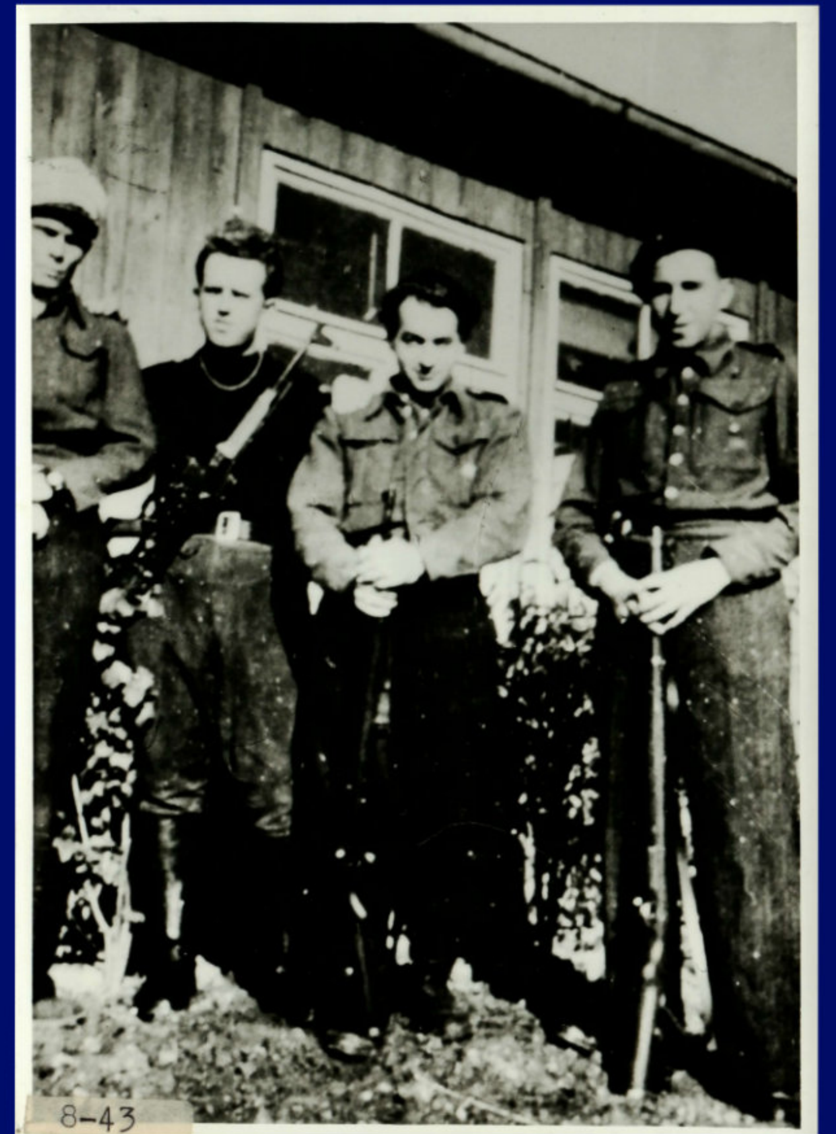
STRÁŽNÍ SBĚRNÉHO TÁBORA V MEZIMĚSTÍ - BEZ DATECE