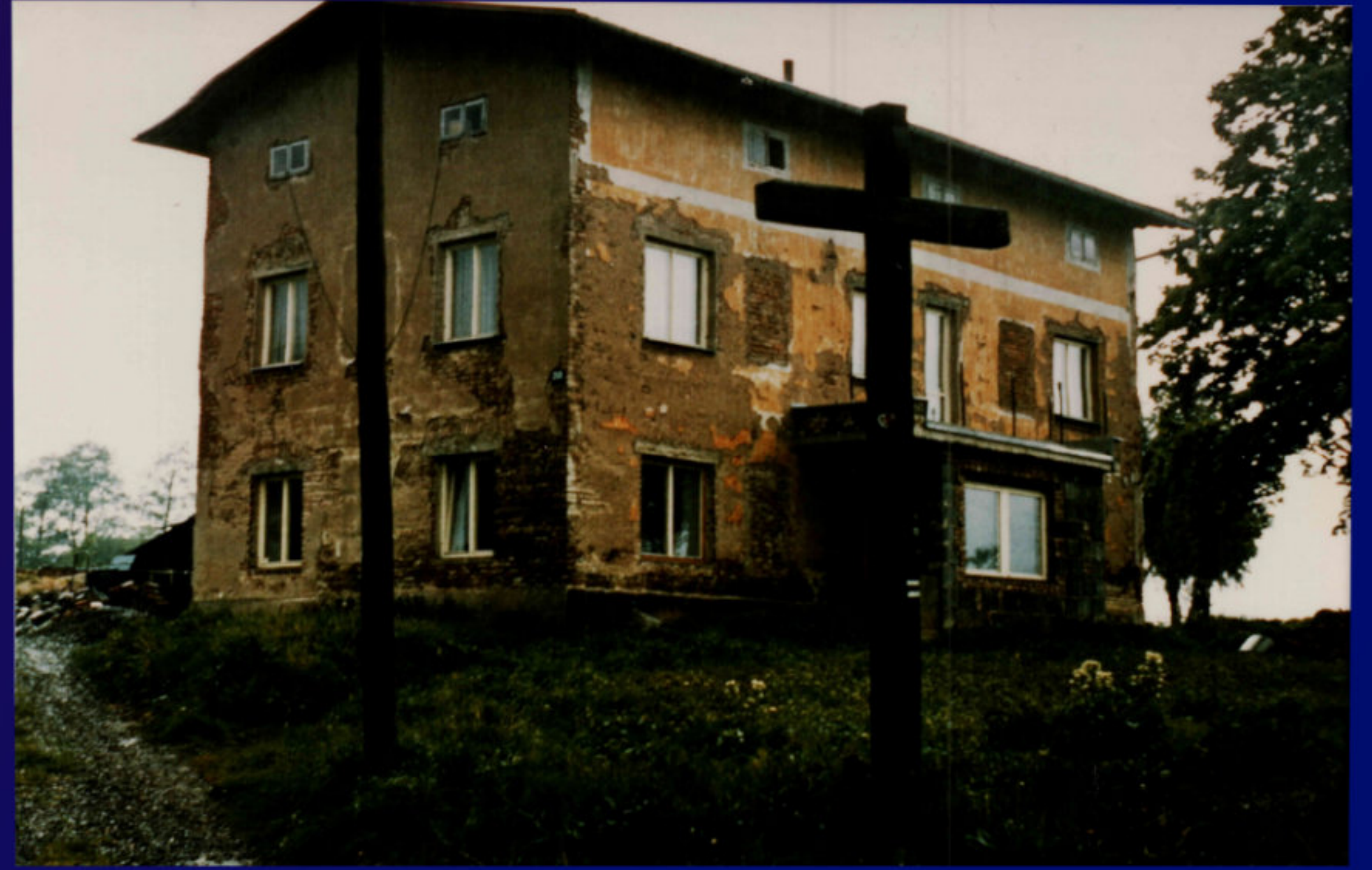
DŮM ČP.250 - 1995