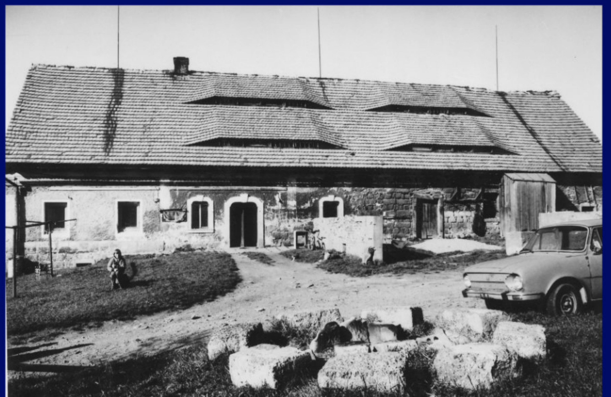
DVOREC USEDLOSTI ČP.159 - BEZ DATECE