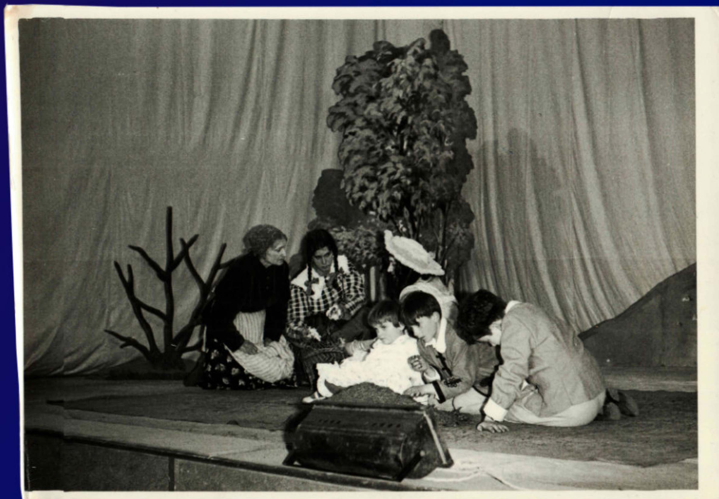
INSCENACE BABIČKY - 1972