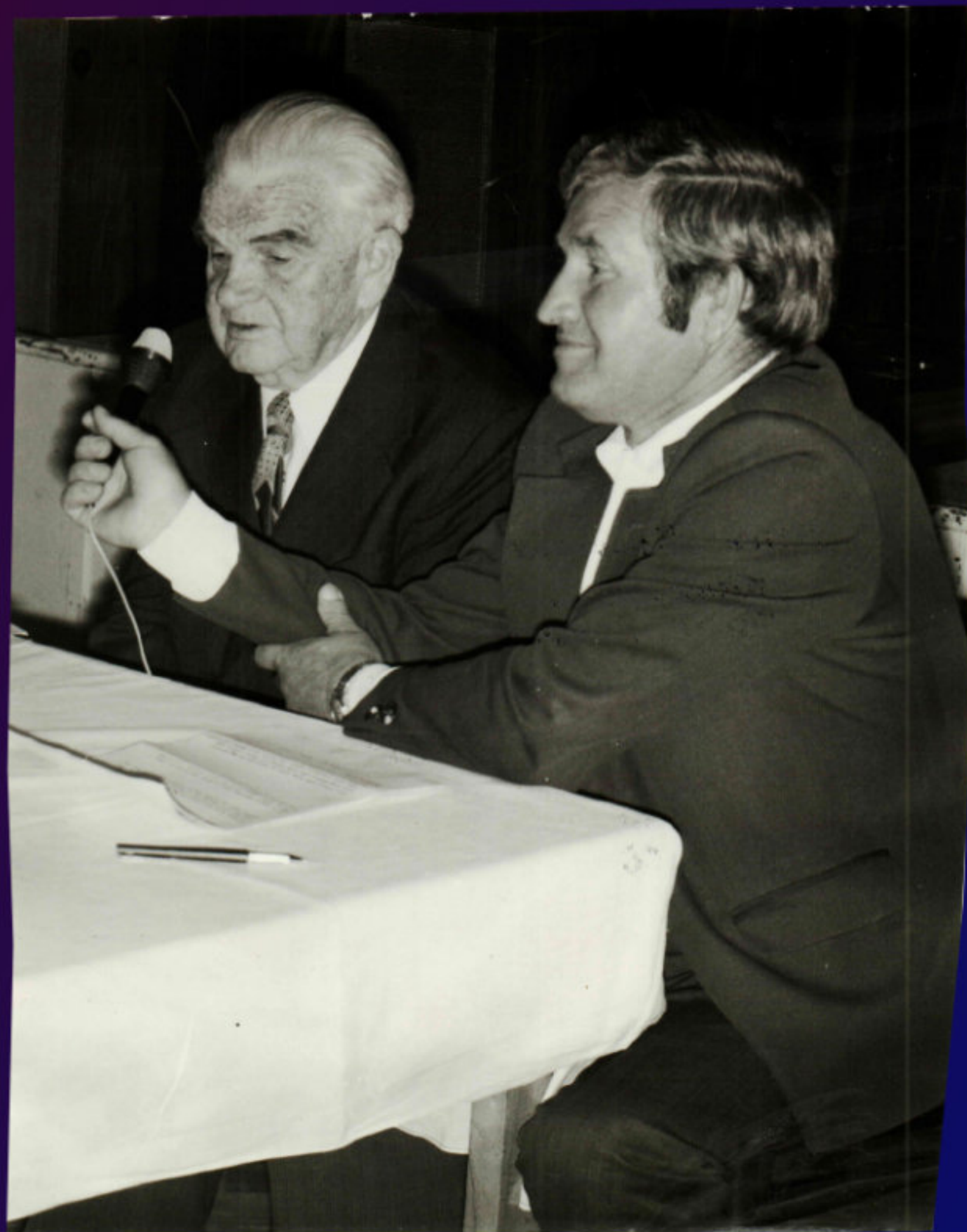
PAN LÁCHA A PAN HARVIŠ - REŽIE BABIČKY 1972