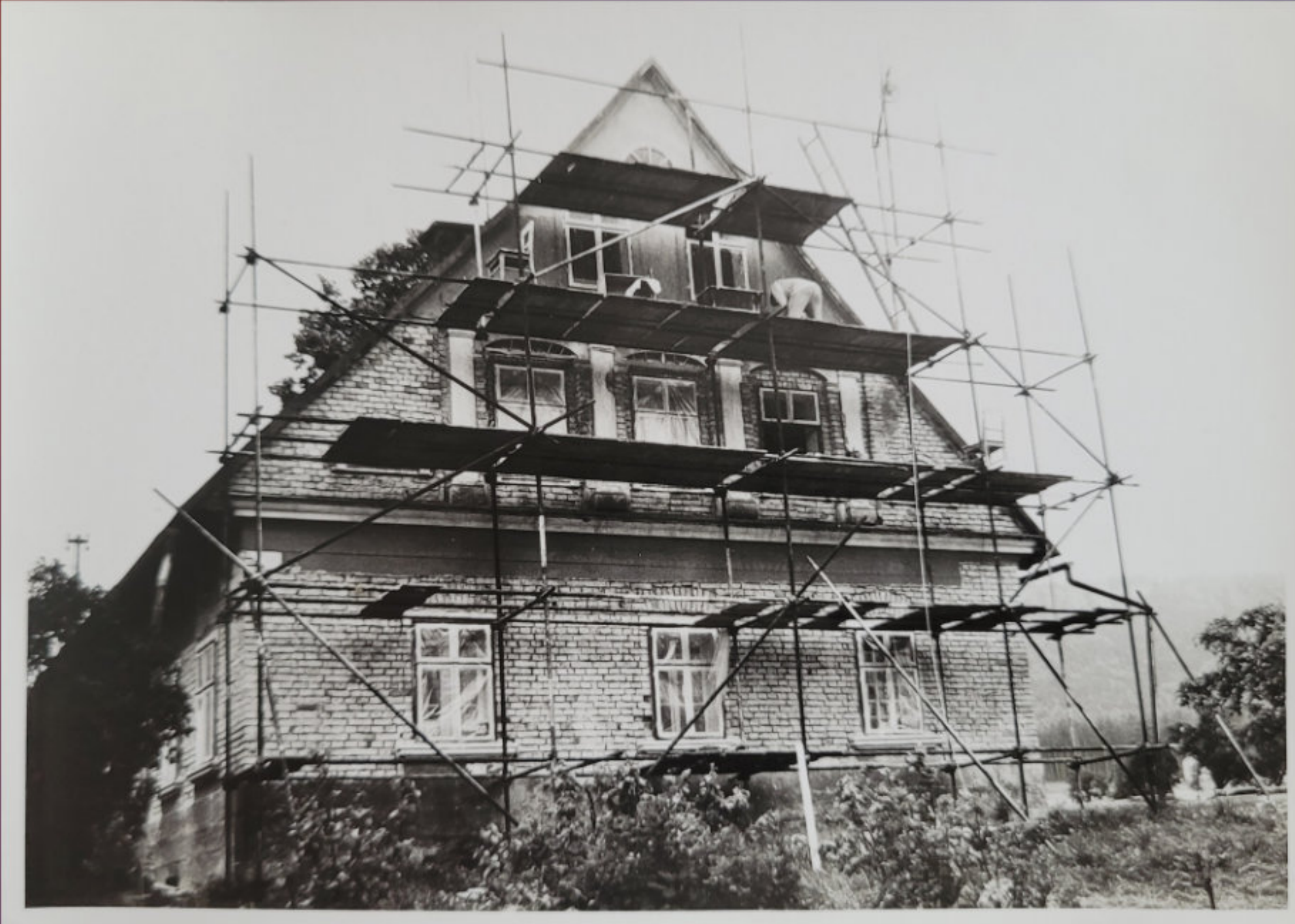
STATEK ČP.106 PŘI OPRAVĚ - ČELNÍ STRANA S LEŠENÍM - 1978