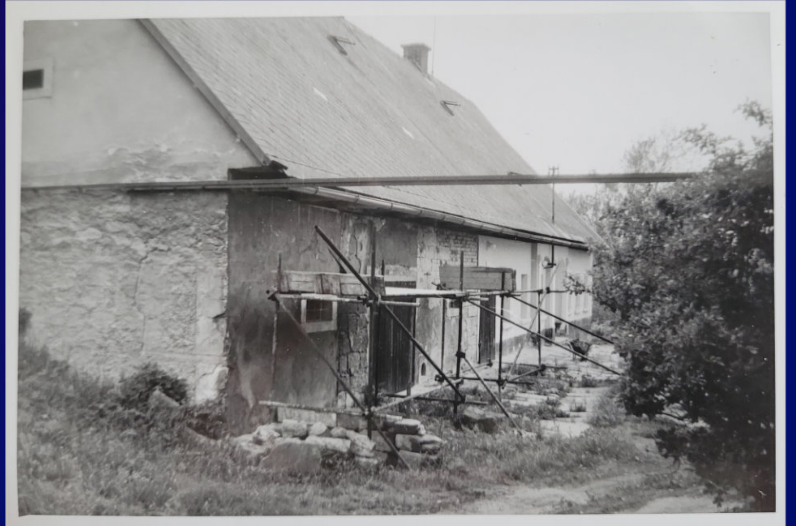
STATEK ČP.106 PŘI OPRAVĚ - ZADNÍ ČÁST STATKU - 1978