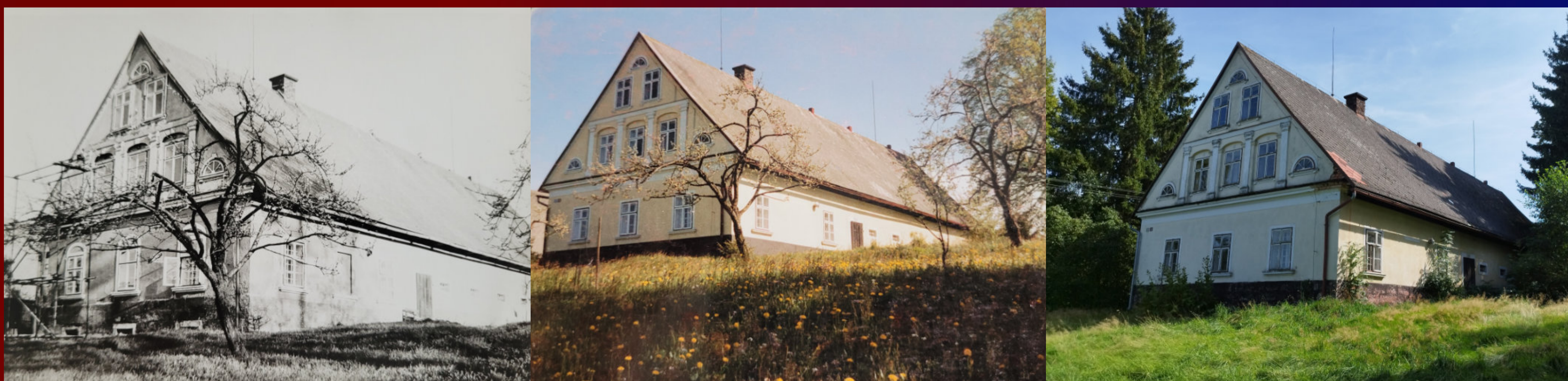
STATEK ČP. 106 VYFOCENÝ PŘI OPRAVĚ FASÁDY V ROCE 1978, PO OPRAVĚ FASÁDY V ROCE 1980 A V SOUČASNÉ PODOBĚ V ROCE 2023