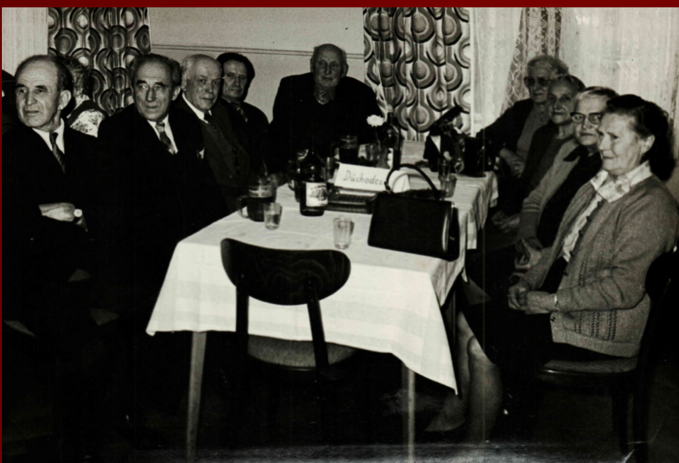
BESEDA S DŮCHODCI

Ke kultuře určitě patří i hospody. Těch v Křinicích po odsunu fungovalo až šest rozsetých po celé délce vesnice. Od Country clubu Krymz, až po restauraci Amerika, která zůstala, i přes období totalitního režimu, v rukou soukromých vlastníků a dodnes stále funguje. Pan Scholz vzpomíná, že v Křinicích bývalo sedm německých hospod, Krims, Schölzerei, Gasthaus Meier, Kaiserkrone, Gasthaus Wartzel, Stadt Breslau, Kahlermühle. Dále také dnešní Amerika a Hvězda.