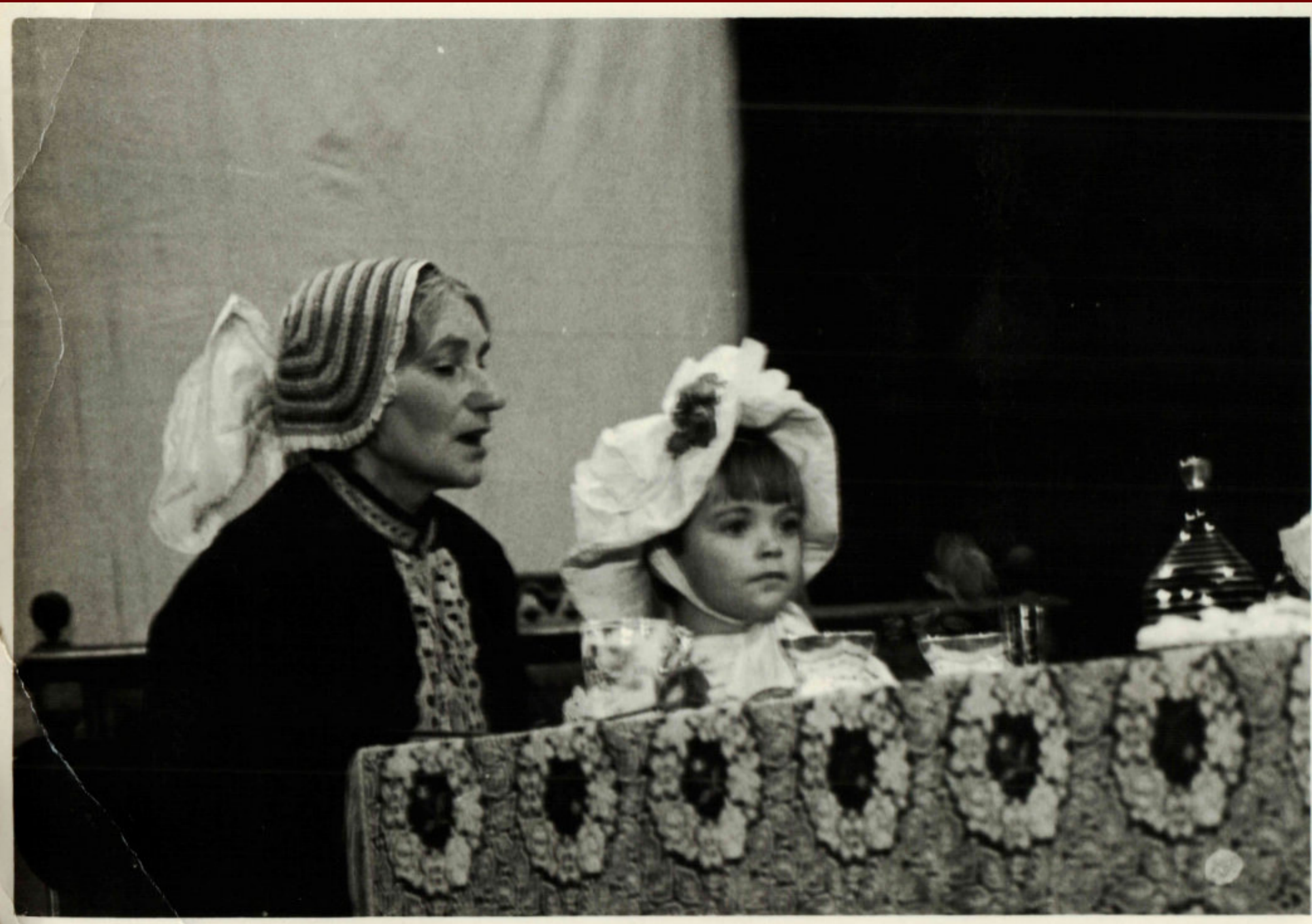
FOTOGRAFIE Z DIVADELNÍ HRY BABIČKA Z ROKU 1972

Naštěstí pro nás, celé kulturní dění v obci bylo rok co rok zapisováno do takzvaného Jednotného plánu kulturní a osvětové činnosti. Například v roce 1965 se mohli občané Křinic těšit na pochod Hvězdeckým pohořím na 15 a 25 km. Nechyběl také každoroční lampionový průvod v rámci oslav 1. máje nebo besedy s občany, a to od těch nejmladších, až po ty nejstarší. Obec podporovala také sport, ať už turnajem v kopané, nebo stolním tenisu. A zimní období si lidé mohli zpestřit mimo jiné bruslením na několika obecních rybnících.